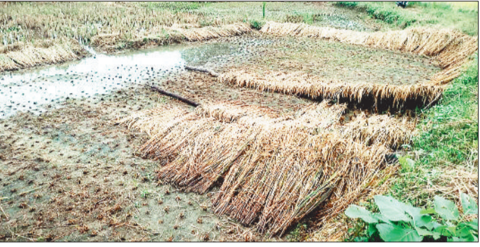
बारिश से भीगी धान की फसल।

चक्रवाती तूफान के प्रभाव से हुई बारिश ने क्षेत्र में भारी तबाही मचाई है। तूफान के प्रभाव से पिछले पांच दिनों से छिटपुट बारिश हो रही है वहीं कुछ इलाकों में घने बादल छाने के साथ ही रूक-रूक कर बारिश हो रही है। बारिश ने धान की पकी फसल को भारी नुकसान पहुंचाया है। इस बार निर्धारित समय के पूर्व मानसून की वर्षा होने के कारण चांदनी-बिहारपुर क्षेत्र के किसानों ने समय पर धान की रोपाई कर दी थी। बीच-बीच में पर्याप्त वर्षा होने के कारण धान की फसल एक सप्ताह पूर्व पककर तैयार हो गई। किसान लगभग आधी फसल ही काट पाए थे कि चक्रवाती तूफान मोंथा सक्रिय हो गया तो रूक-रूककर बारिश होने लगी। इस दौरान मौसम का हाल देख कुछ किसानों ने अपनी फसल की मिसाई कर ली जबकि शेष किसानों की फसल खेतों में पड़ी रह गई। तेज हवा के साथ बारिश होने के कारण धान की खड़ी फसल लेट गई वहीं काटने के बाद सूखने के लिए रखी गई धान की फसल बारिश में भीगती रही। खेतों में बारिश का पानी